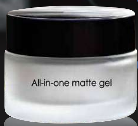
All-in-one matte gel